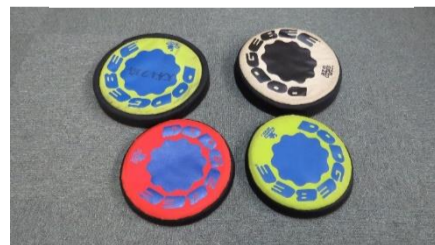
12 ドッチビー(室内・屋)