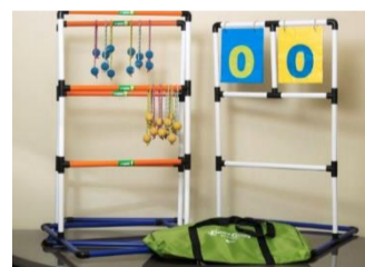
2 ラダーゲッター(室内)